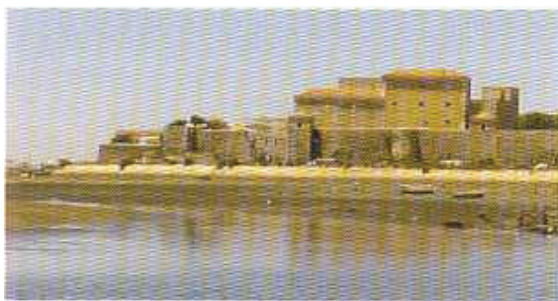
Castelo de Faro, visto da Ria, onde está a instalar-se o Museu Municipal (vide pág. 10 desta revista).

Ao longo do século XIX os museus multiplicaram-se na Europa, com recurso a palácios, conventos e outros edifícios geralmente de grandes dimensões que foram perdendo o uso inicial. Mais tarde, num ou noutro caso, e aproveitando também entretanto fábricas desactivadas, começaram a ser construídos edifícios de raiz destinados a funções museológicas, muitas vezes de carácter monumental.