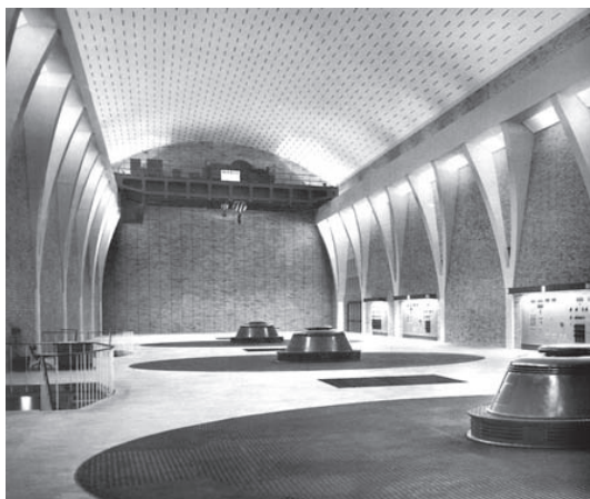
A portentosa nave dos alternadores da central de Miranda do Douro