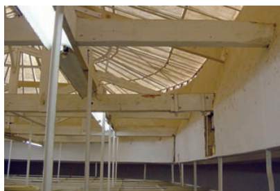
Antes da intervenção

A Monumenta, Ld. a executou recentemente a reabilitação da cobertura e sobre-céu da Sala Cinco do Museu José Malhoa, sito nas Caldas da Rainha, com vista à realização da exposição comemorativa dos 150 anos do nascimento de José Malhoa intitulada “Malhoa e Bordalo: confluências duma geração”.