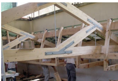
Durante a intervenção

A Sala 5, sobre a qual recaiu a fase de intervenção, é uma das duas salas de maior destaque na orgânica de utili-