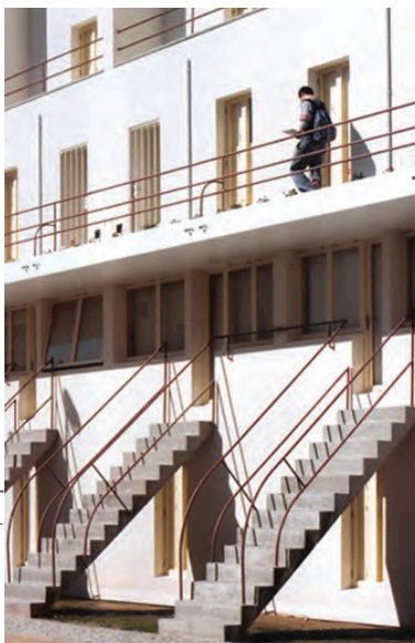
Fernando Guerra/Arquitectura e Vida

Com o intuito de acelerar este processo, a lei n.º 107-8 de 2003 regulamentou a alienação do património habita-