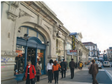
Vista do exterior do Mercado do Bolhão – entrada Norte

Classificado como imóvel de interesse público desde 2006, o edifício encontra-se actualmente num estado de degradação avançado, que põe em risco o correcto funcionamento