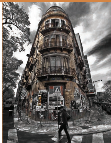
Av. Casal Ribeiro. Edifício onde morou Fernando Pessoa.