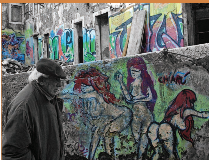
Pátio de Dom Fradique.