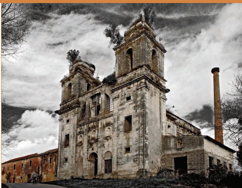
Mosteiro de Santa Maria de Seixa.

O projecto Ruin'arte é uma forma de protesto pessoal com uma visão artística, que visa chamar a atenção para a degradação do património, verdadeiro descalabro.